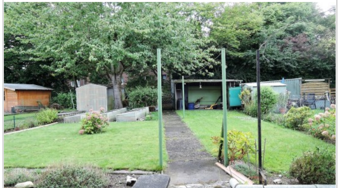
Zum Genießen der sonnigen Tage