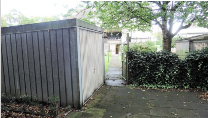
Direkter Zugang zum Garten!