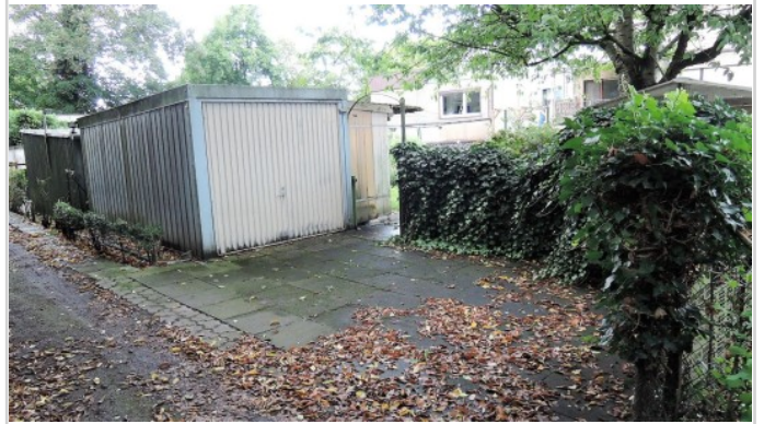
Garage am Ende des Grundstück!