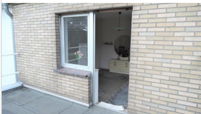
Blick vom Balkon ins Schlafz!