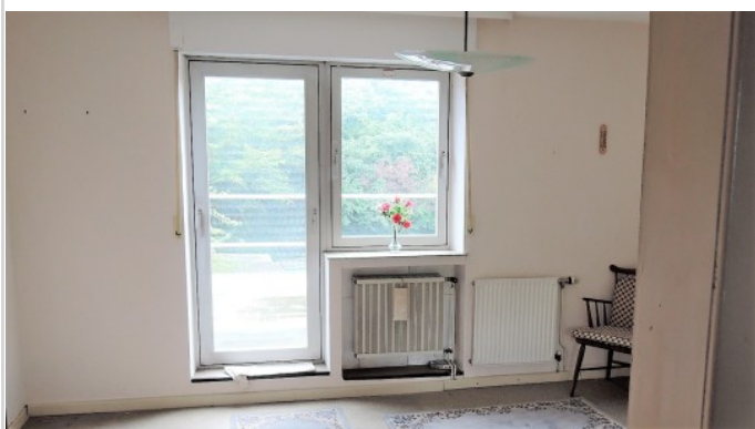
Zugang zum Balkon!

Zimmer: 3,00 Wohnfläche ca.: 70,00 m 2 Kaufpreis: 117.000,00 EUR